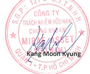
Kang Moon Kyung